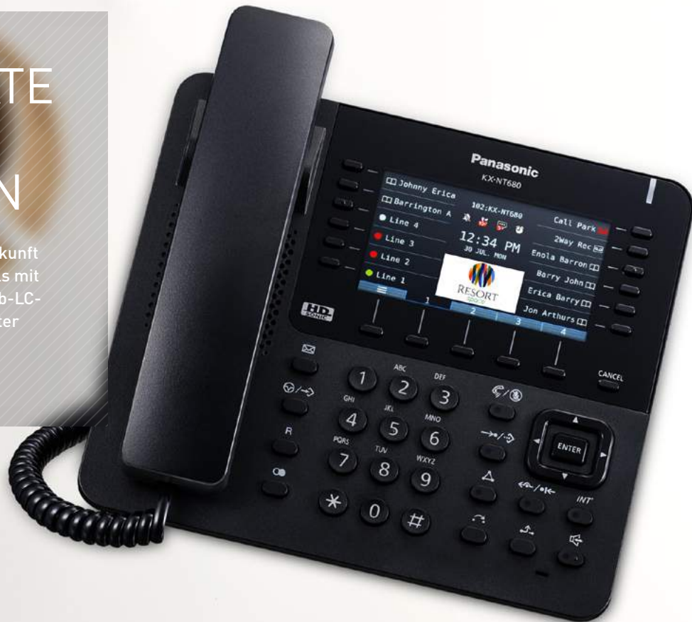
HD SONIC KX-NT680 Farb-LC-Display

Um der schnelllebigen Geschäftswelt auch in Zukunft gerecht zu werden, bietet Panasonic IP-Terminals mit modernster Technologie an. Das gut lesbare Farb-LC-Display mit integriertem HD-Audio und optimierter Bedienoberfläche erfüllt alle Anforderungen moderner User.